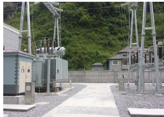
站内铺设碎石及地面硬化