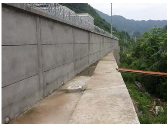
变电站围墙外及防护措施