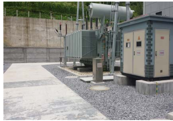
2#变压器及事故油坑