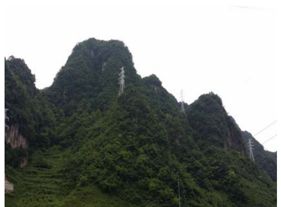
图 1 环境保护措施现场照片