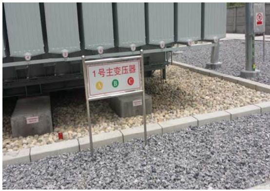
1#变压器及事故油坑